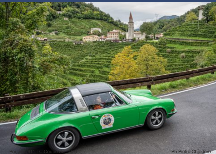
Porsche 911 T Coupe del 1973