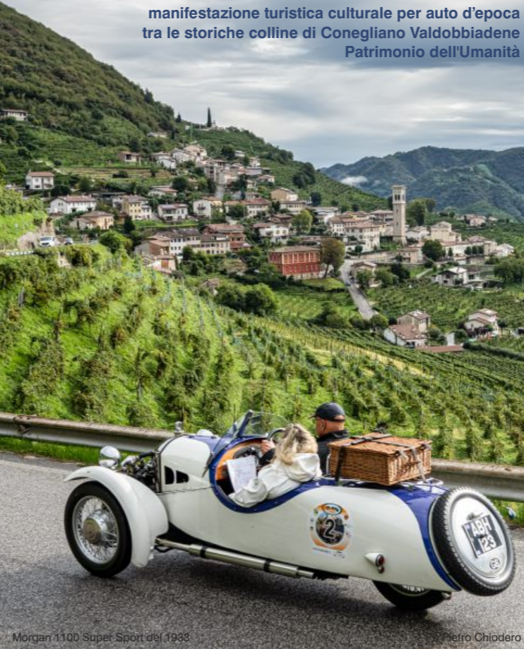
Morgan 1100 Super Sport del 1933